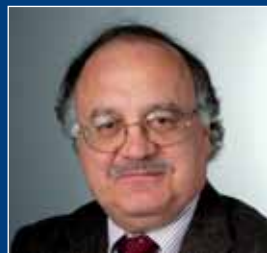
Presidente del Congresso