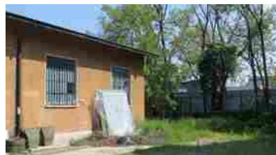
Cusano Milanino Podgora 459 mq,