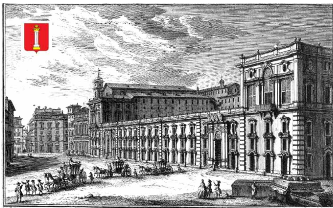
Palazzo Colonna L'Annuncio nel giardino di detto Palazzo, e Appart. nuovi del moderno Palazzo per uso della famiglia, Chiesa dei XII SS. Apostoli, e Palazzo Muti