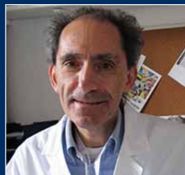
Presidente del Congresso